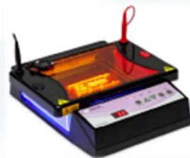
RunSafe View System Sistema All-in One, apparato di corsa, alimentatore, transilluminatore