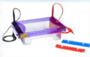
Horizontal Multi Sub System Apparato di corsa orizzontale presente in vari formati