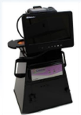
MicroDOC Gel Documentation System Sistema base per la foto acquisizione di Gel