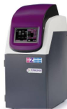
GelONE Gel Documentation System Sistema Stand-Alone completo per la foto acquisizione di gel e membrane