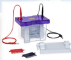
Vertical OmniPage System Apparato di corsa verticale disponibile in vari formati