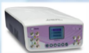
PowerPro Power Supply Alimentatore 500V / 800mA